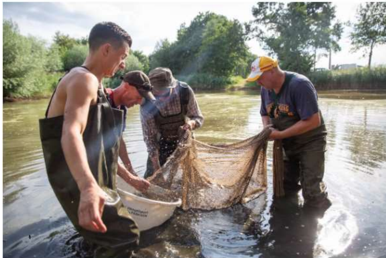
Een vijver in Bathmen wordt leeggevist om de vissen te redden van gebrek aan zuurstof.