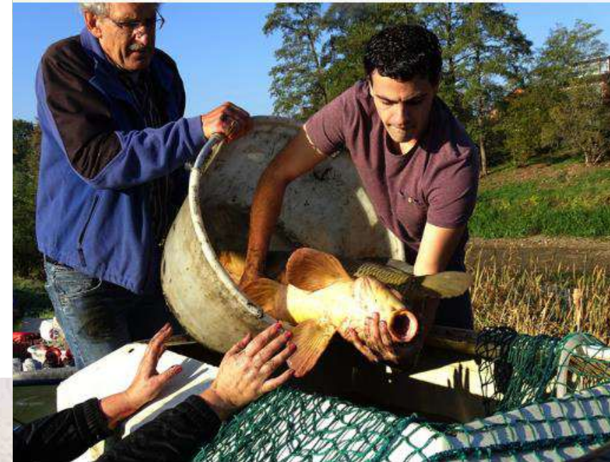
▲ Voorzichtig worden de vissen weggehaald uit de grotendeels droog gevallen Laak bij Rheden beïjnd.